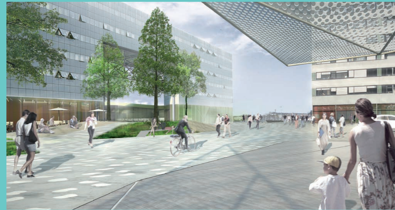
Le parvis sud de la gare doit accueillir un espace public de qualité, favorable à la détente et à la promenade autant qu'à l'efficacité des déplacements.

Elle définit les grands objectifs d'un cadre de programmation exigeant sur les thèmes des mobilités, de la gestion des nuisances, de l'énergie, des ambiances architecturale, urbaine et paysagère. Elle a vocation à conférer de la valeur ajoutée économique, sociale et culturelle au projet, en réduisant son empreinte environnementale.